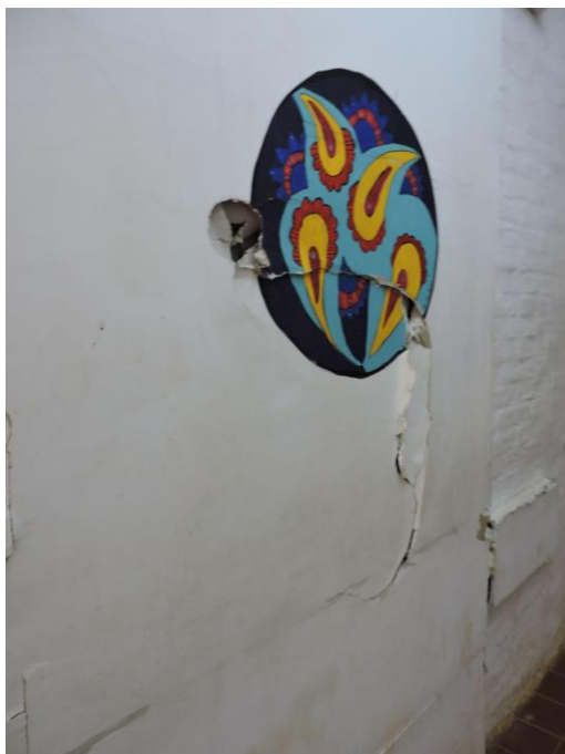
Foto 3. Pared al interior del centro. Registro fotográfico del MNP octubre 2021.