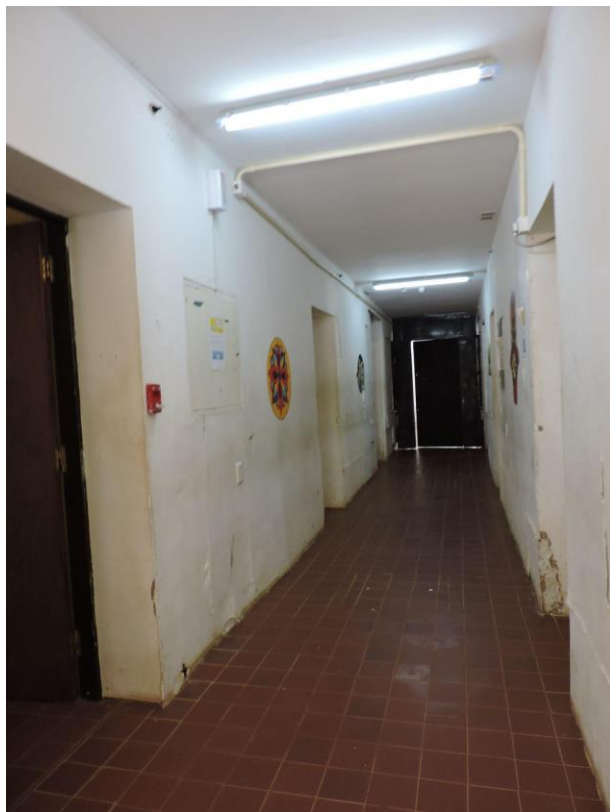
Foto 2. Acceso a los dormitorios.