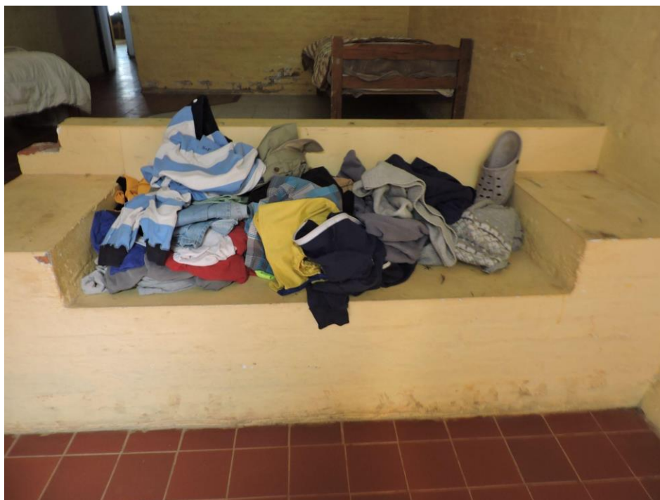
Foto 4. Dormitorio de adolescentes. Registro fotográfico del MNP octubre 2021.

En la última visita (7 de octubre del 2021) se constataron diferencias en los dormitorios, tanto en elementos de seguridad, como en equipamiento, así como la conservación de objetos personales o decorativos en los dormitorios.