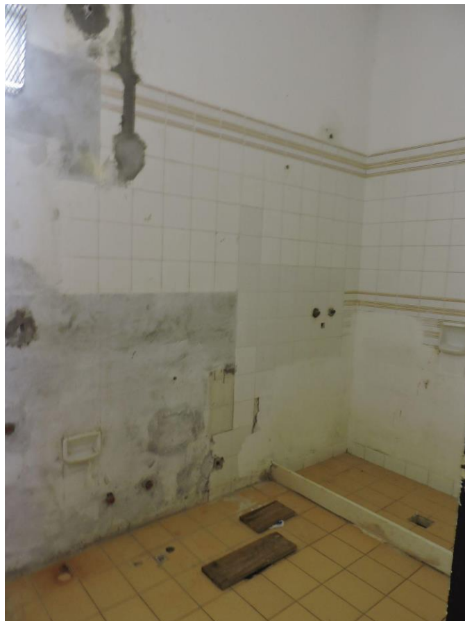
Foto 1. Baño Sala de cuidados especiales mujeres.

El acceso a ambas salas desde enfermería no es sencillo ni rápido por las puertas que se interponen. De todas formas, cada dormitorio y sala de contención posee cámaras, con un monitor que se encuentra en la enfermería.